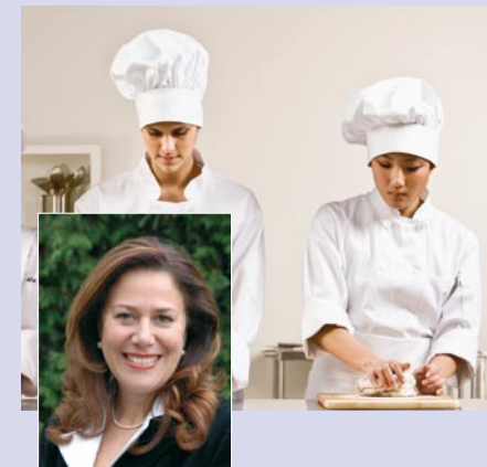
Catherine Troendle Sénateur et maire de Ranspach-le-Bas, Haut-Rhin, 620 habitants

« Le Fonds social européen est un outil essentiel pour les collectivités mobilisées en faveur de l'emploi et de l'insertion sociale.