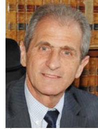
Hubert FALCO Secrétaire d'Etat chargé de l'Aménagement du territoire